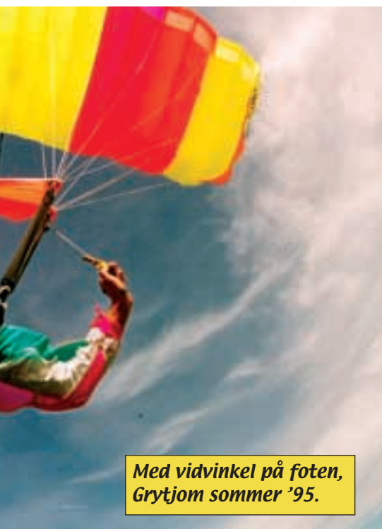
Med vidvinkel på foten, Grytjom sommer '95.